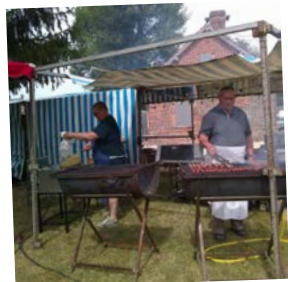
Cuisson des saucisses et merguez