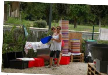
Dimanche : nettoyage et rangement