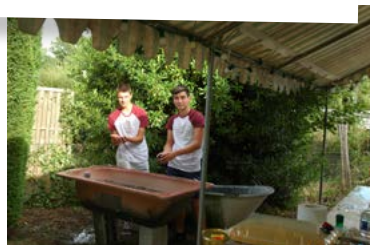
Préparation des moules