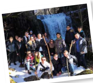
Un séjour en Espagne du 8 au 13 avril à Barcelone devant la Sagrada Família