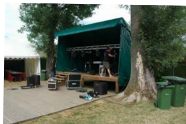
Installation de la sono

Nous avons tous passé une excellente soirée. Les moules étaient excellentes et les saucisses/merguez cuites à la perfection. Près de 700 repas ont été servis au cours de la soirée. Notre DJ Willy de Prestige Animation a su nous faire danser sur des rythmes très différents mais toujours aussi agréables.