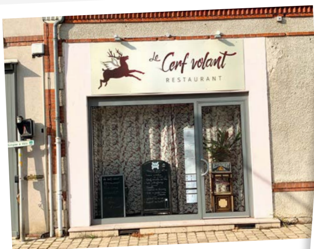
Le Cerf Volant