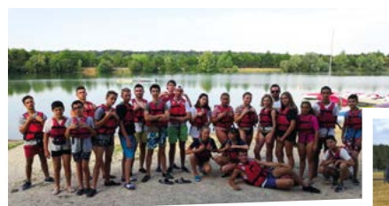
Vacances de la Toussaint : ouverture une semaine

Du 08 juillet au 2 août : ALSH ouvert sur 4 semaines avec un séjour de 5 jours à Villiers sur Loir, un séjour cirque avec un spectacle, nous avons également fait une sortie à Disneyland Paris, fête les 10 ans d'ouverture de L'AdolesCentre et fait notre 9 ème Koh Lanta Solognot.